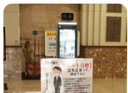
検温サーモカメラ