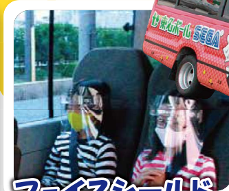
フェイスシールド