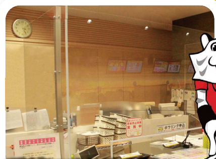
受付にアクリル板