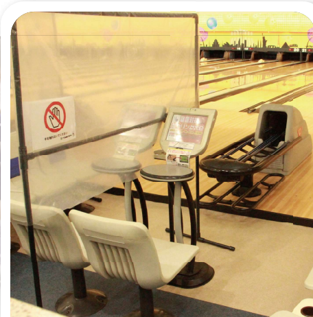
1レーンごとに間仕切り